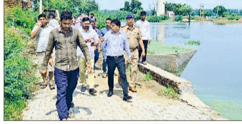
नरवाना। निरीक्षण करते एसडीएम।