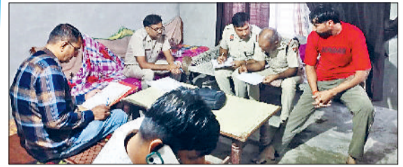
राजौद। सीएम फ्लाइंग ने किया गांव खुरडा में चल रही अवैध पटाखा फैक्ट्री का भंडाफोड़