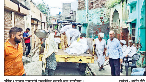
जीद। राहत सामग्री एकत्रित करते हुए ग्रामीण।