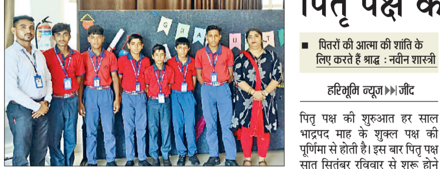
राजौद। अमर पब्लिक स्कूल के सीबीएसई अथलेटिक्स और बॉक्सिंग स्टेट लेवल कम्पटीशन में अव्वल प्रदर्शन करने वाले छात्र।