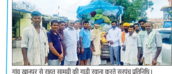
गांव खानपुर से राहत सामग्री की गाड़ी रवाना करते सरपंच प्रतिनिधि।