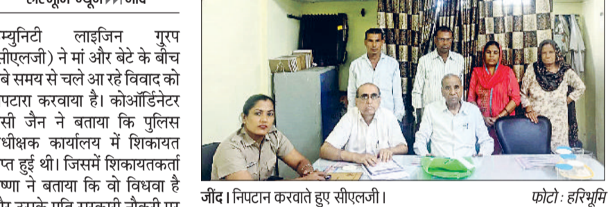
जीद। निपटारा करवाते हुए सीएलजी।