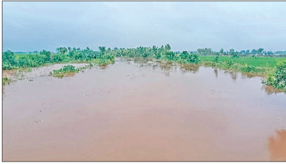
गुहला चीका। घग्घर नदी में बह रहा पानी।

हलकावासियों को सता रहा बाढ़ का भय, प्रशासन की अपील हम आपके साथ खड़े