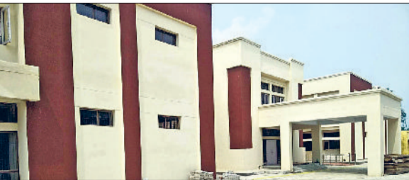
अलेवा। सीएचसी अलेवा का वह भवन जिसमें 36 घंटे से बिजली नहीं।

सीएचसी अलेवा की बिजली मामले में 36 घंटे से बत्ती गुल है, लेकिन इतना समय बीतने के बावजूद भी बिजली कर्मचारी फाल्ट ढूँढ पाने में नाकाम साबित हो रहे हैं। जिसके कारण सीएचसी अलेवा के फ्रीजर में रखी वैक्सीन के अलावा डिलीवरी हट तथा आपातकालीन सेवाओं पर खतरा मंडरा रहा है। हालांकि इस दौरान स्वास्थ्य विभाग के अधिकारियों द्वारा सीएचसी में जरनेटर की सुविधा लेनी की बात कही जा रही है। सीएचसी अलेवा में