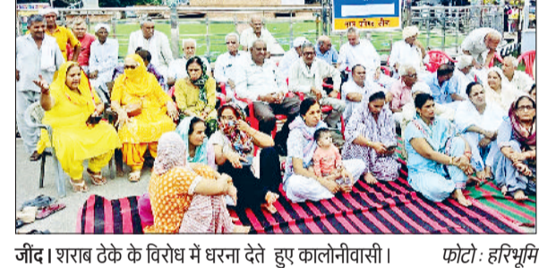
जीद। शराब टेके के विरोध में धरना देते हुए कालोनीवासी।