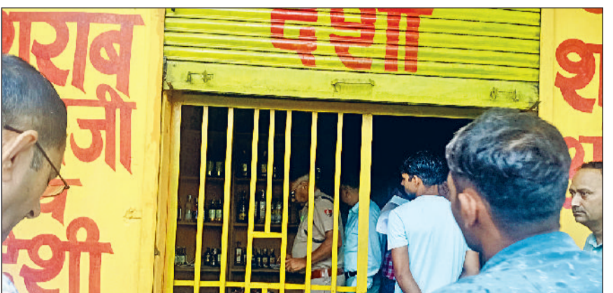
जीद। शराब टेके की जांच करते हुए टीम सदस्य।