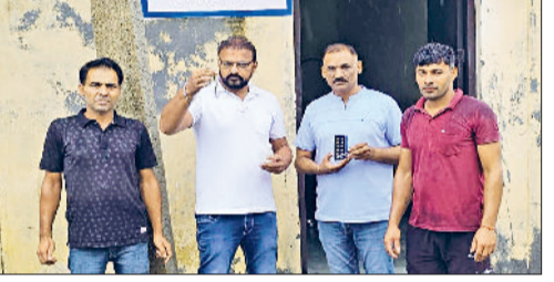
पाई। स्वास्थ्य विभाग की टीम बुरिस्टिंग स्टेशनों की जांच करते।