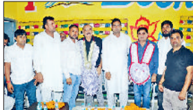
जीद। घसो खुर्द में आयोजित सम्मान समारोह कार्यक्रम।